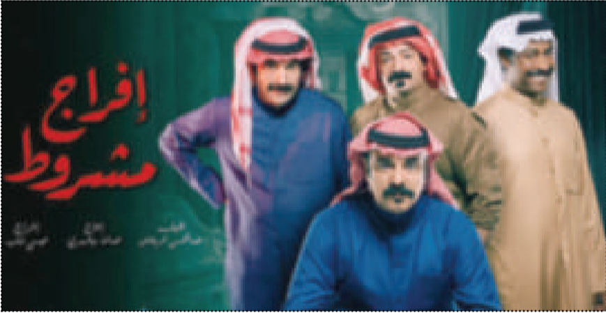
مع نجوم «افراج مشروط»

في جملة تجارب، لا يمثل.. بل يعيش ويتقمص ويذوب في الشخصية، بل يجعلها تذهب إليه فتكون جزءاً منه وهو جزء منها. هنالك كيميائية نادرة، يستخدمها هذا الفنان، وهو يقف امام الكاميرا، ليمنح قدراته وامكانياته وتجربته العريضة، للتعبير عن مكونات الشخصية وارهاساتها، وليحول شخصية «عبدالرحمن سالم» إلى شخصية حقيقية تعيش وتنضج وتتفاعل. عبر تلك الكيمائية وتفاعلاتها بأسرنا.. يشغلنا.. يسرقنا من بقية الشخصيات رغم مكانتهم وحضورهم.. ولياقتهم.