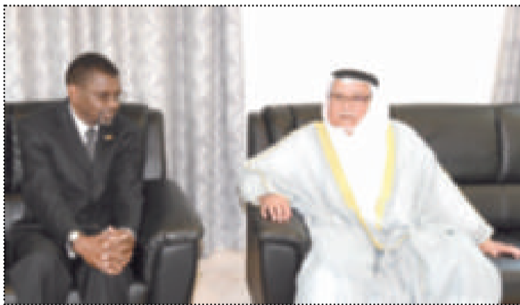
● الشيخ علي الجراح مقدماً واجب العزاء

قام وزير شؤون الديوان الأميري الشيخ علي جراح الصباح أمس بزيارة إلى سفارة جمهورية زيمبابوي لدى الكويت حيث نقل تعازي صاحب السمو أمير البلاد الشيخ صباح الأحمد وسمو نائب الأمير ولي العهد الشيخ نواف الأحمد وسمو الشيخ جابر المبارك رئيس مجلس الوزراء وحكومة وشعب الكويت وذلك بوفاة الرئيس السابق لجمهورية زيمبابوي روبرت غابرييل موغابي.