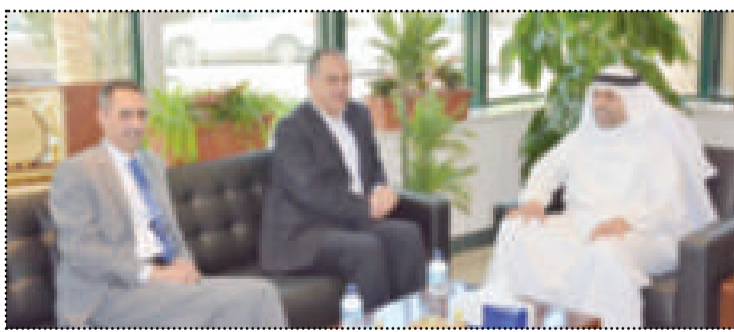
● الجبري مستقبلاً وزير الزراعة الأردني

بحث وزير الإعلام وزير الدولة لشؤون الشباب رئيس الهيئة العامة لشؤون الزراعة والثروة السمكية محمد الجبري مع وزير الزراعة وزير البيئة الأردني إبراهيم الشاحدة أوجه التعاون المشترك وسبل تطوير التبادل الاستثماري والتجاري وتصدير المنتجات الزراعية والعمل على تحقيق الأمن والغذائي للبلدين.