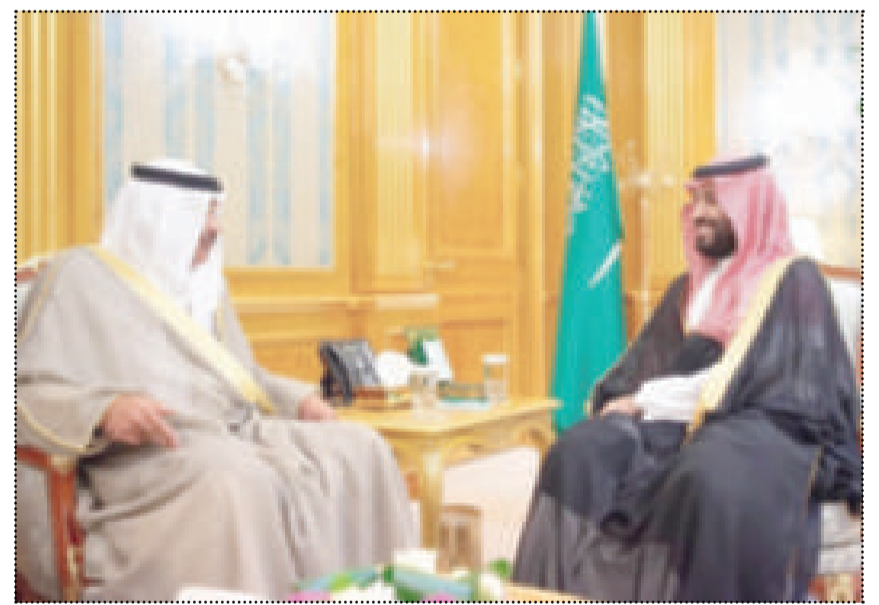
● ولي العهد السعودي خلال استقباله مبعوث سمو أمير البلاد

حضر اللقاء مساعد وزير الخارجية لشؤون مكتب نائب رئيس مجلس الوزراء وزير الخارجية السفير الشيخ الدكتور أحمد ناصر المحمد الصباح وسفير الكويت لدى المملكة العربية السعودية السفير الشيخ علي خالد الجابر الصباح، فيما حضره من الجانب السعودي صاحب السمو الملكي الأمير تركي بن محمد بن فهد بن عبدالعزيز وزير الدولة عضو مجلس الوزراء ووزير الدولة للشؤون الخارجية عضو مجلس الوزراء عادل الجبير.