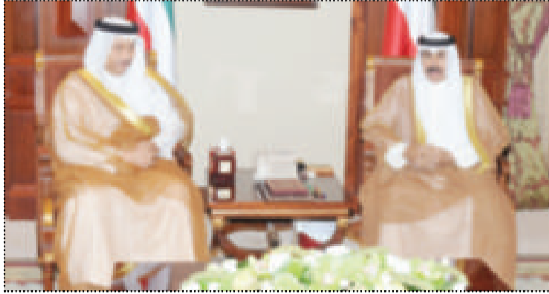
● سموه لدى استقباله سمو الشيخ جابر المبارك