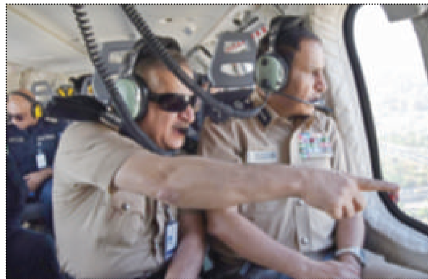
● الفريق النهام واللواء الصايغ خلال الجولة الجوية