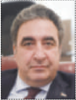
● السفير ايلخان قهرمان