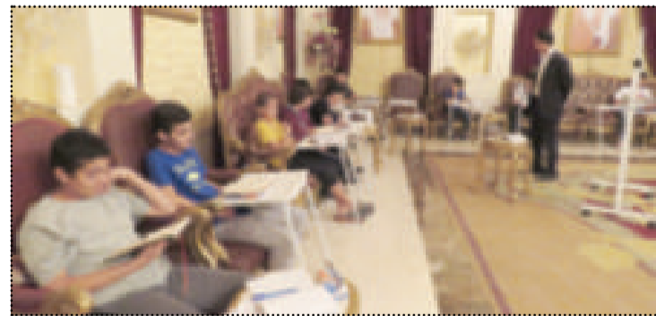
● خلال الفعالية

للسنة التاسعة على التوالي تعود دار العثمان لاستئناف دورة المرجوم عبدالله عبد اللطيف العثمان لتحفيظ القرآن الكريم واللغة العربية، والمخصصة للمرحلة الابتدائية والمتوسطة، بالإضافة لفصل خاص للنساء، حيث تقام الدورة من كل عام ويشارك بها أكثر من 100 مشترك ومشتركة سنوياً، ويصاحب الدورة العديد من الأنشطة والفعاليات التوعوية الهادفة.