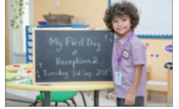
● أحد الطلاب