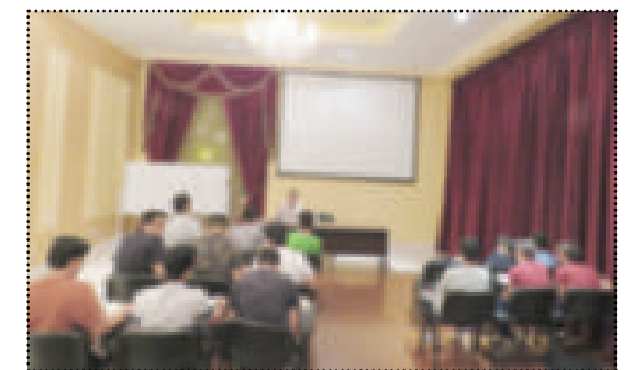
● الطلبة المشاركون