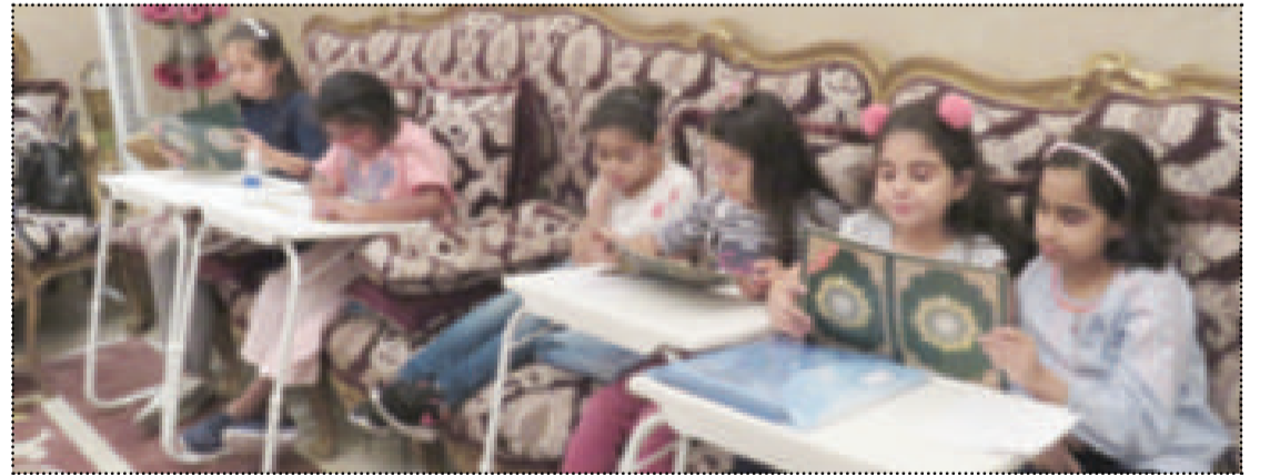
● الطالبات في إحدى الحلقات