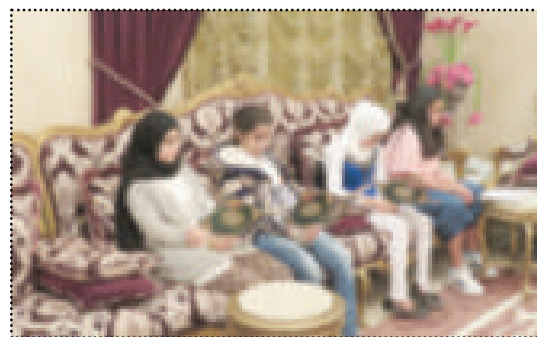
● حفظ القرآن

لتقوية اللغة العربية، ضمن منهج دار العثمان في عدة مستويات تبدأ بالأحرف ثم الكلمات والجمل، وبعد ذلك قواعد اللغة العربية للسنة الأكبر، ويتم تقديم وجبات صحية للأطفال خلال فترة الاستراحة، كما يصاحب الدروس أنشطة وفعاليات متنوعة تساهم في تعزيز الأخلاقيات والآداب