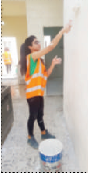
● من المتطوعين