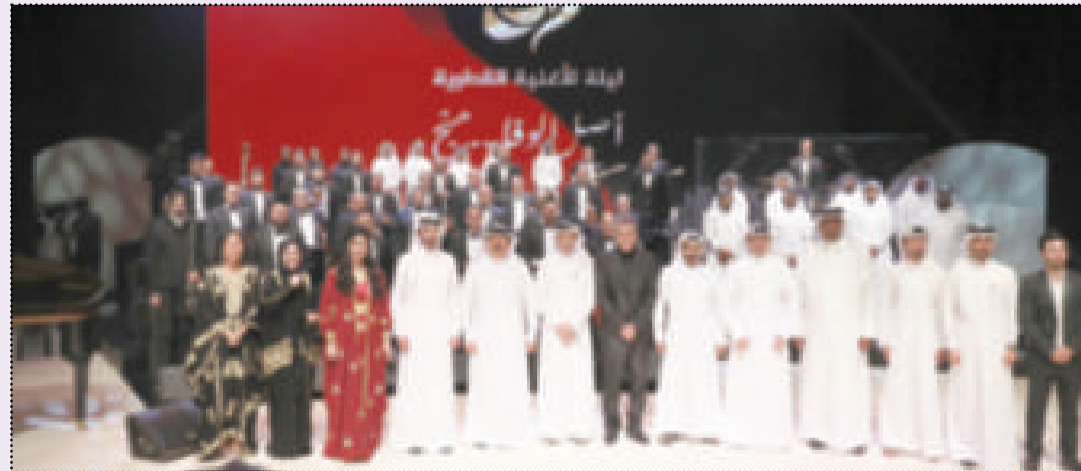
الوزير صلاح العلي متوسطاً المشاركين في «ليلة الأغنية القطرية»