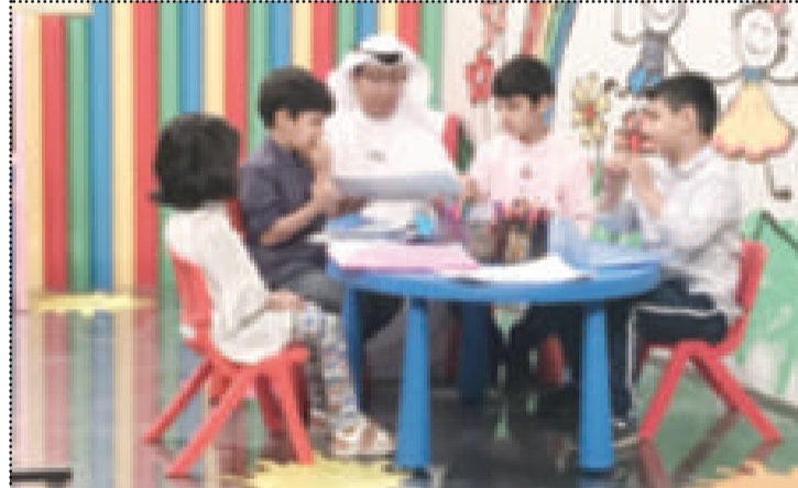
تلاب خلال البرنامج مع الصغار

وأفكار معينة وعمل ابدية للبرنامج وإضافة ما هو جديد ونحاول التركيز على الشفافية مع الطفل ونعتمد على البساطة والتلقائية. وأضاف قائلاً : وجدنا كل الدعم من قيادات الاعلام بداية من وزير الاعلام ووكيل الوزارة وايضا الوكيل المساعد لقطاع