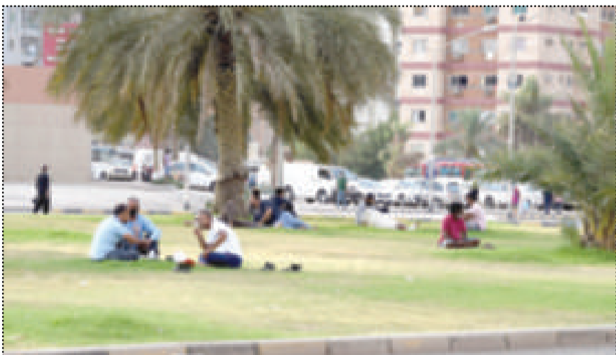
مقيمون خرجوا لقضاء وقت ما قبل الحظر في المساحات الخضراء