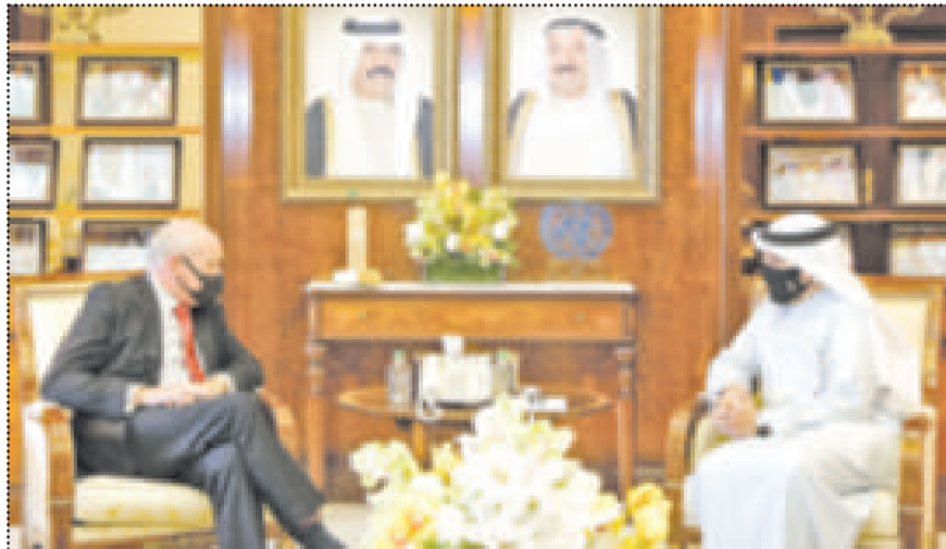
الشيخ د. أحمد الناصر مستقبلاً السفير المولندي