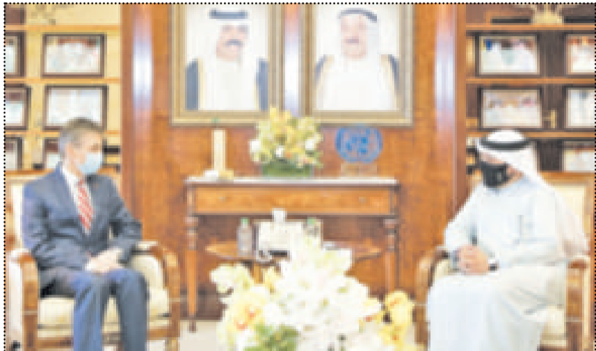
.. ومستقبلاً سفير النمسا