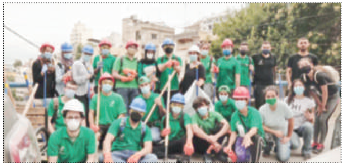
● مجموعة من أعضاء «لويك لبنان» في صورة جماعية

إثر فاجعة الانفجار الماساوي الذي حل بالعاصمة اللبنانية «بيروت» كانت مؤسسة لويك لبنان في قلب الحدث، بمشاركة عشرات من الشباب المتطوعين تحت شعار «انهضي يا بيروت» استجابة لنداء الإنسانية. انطلقت الحملة بتعاون ودعم من «لويك الكويت» لتقديم المساعدة السريعة والفورية لمنكوبي انفجار ميناء بيروت. وتحت مظلة برنامج «هومز» للطوارئ تشكلت مجموعة من الفرق من الشباب المتطوع لمواجهة الكارثة ووضعت خطة عملية واضحة لكل فريق من أهم ملامحها: