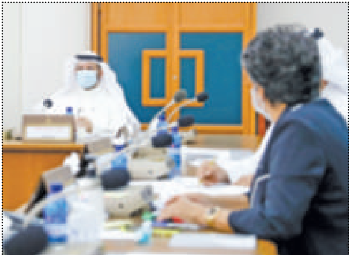
● الشيطان حاضراً اجتماع اللجنة المالية البرلمانية

صدرت من وزارة المالية إلى جميع الجهات الحكومية قائلًا «إن هذه المخاطبة جاءت بناء على قرار مجلس الوزراء بتكليف (المالية) التنسيق مع الجهات المختلفة الميزانية والحساب الختامي البرلمانية. وذكر أن من أبرز ما جاء في مشروع القانون «عدم التعرض لحقوق الموظفين والعاملين» مشدداً على أن ما تم تداوله مجرد اقتراحات وأفكار ولا أساس بجيب المواطنين ولا الموظفين.