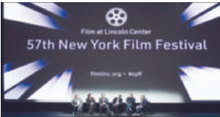
من مهرجان نيويورك السينمائي الماضي