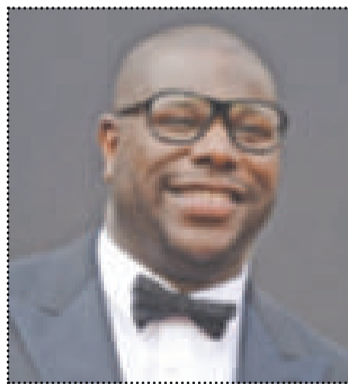
المخرج ستيف ماكويين