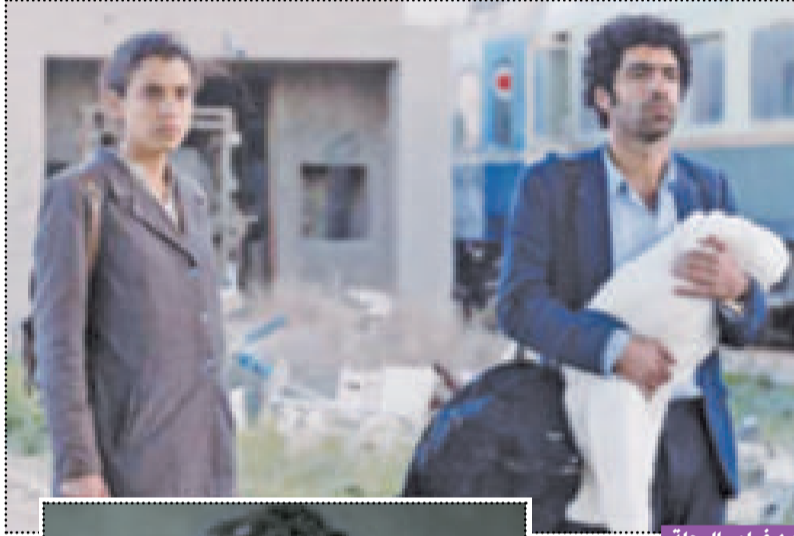
من فيلم «الرحلة»