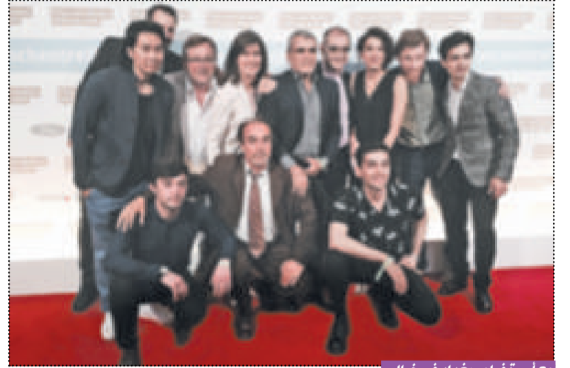
مع أسرة فيلم «بغداد في خيالي»