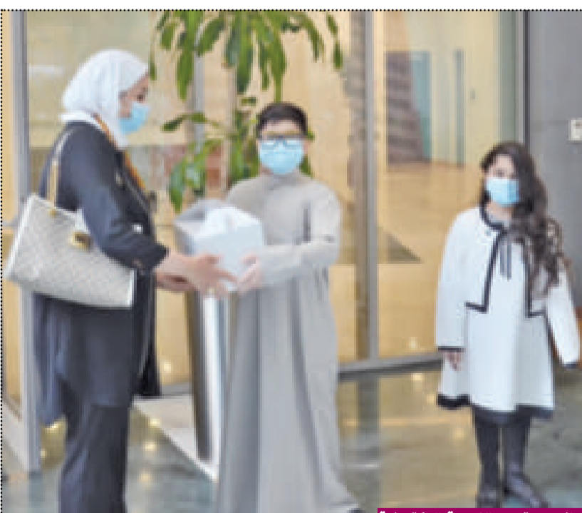
جانب من توزيع الأجهزة الإلكترونية