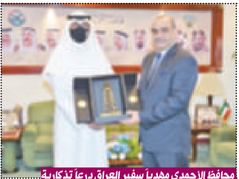
محافظ الأحمد يهدي سفير العراق درعاً تذكارية

استقبل محافظ الأحمد الشيخ فواز الخالد في مكتبه بديوان عام المحافظة، سفير جمهورية العراق الجديد لدى الكويت المنهّل حسين الصافي، حيث جرى التعارف وتبادل الأحاديث الودية حول العلاقات الثنائية التي تربط البلدين الشقيقين وسبل تعزيزها،