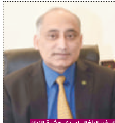
السفير البنغالي ام. دي. عشيق الزمان

كما شهدت بنغلاديش استثماراً أجنبياً مُرضياً في السنوات الخمس الماضية. مشيراً إلى تصنيف تقرير الاستثمار العالمي لعام 2017 لبنغلاديش في المرتبة 16 من بين 74 دولة متلقية للاستثمار الأجنبي المباشر مع رقم قياسي لتدفق الاستثمار الأجنبي المباشر بلغ 2,65 مليار دولار أميركي في عام 2019. موضحاً «وفي السنة المالية 2020، سجلت أرباح التحويلات رقماً قياسياً بواقع 18,21 مليار دولار أميركي، والذي كان 16,52 مليار دولار أميركي في السنة المالية السابقة. إذ تجاوزت احتياطات النقد الأجنبي لبنغلاديش حاجز الـ 40 مليار دولار أميركي لأول مرة وسط جائحة فيروس كورونا. مسترداً كل هذه الإحصائيات تثبت قوة الاقتصاد في بنغلاديش. لذا تفخر بنغلاديش الآن بفخر كوجهة تجارية واستثمارية ناشئة لجميع المستثمرين المحتملين في جميع أنحاء العالم.