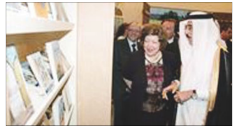
نائبة الرئيس السوري نجاح العطار في جناح دولة قطر

ومشاركة 389 دار نشر عربية وإجنبية. وأكدت العطار في تصريح لوكالة الأنباء الكويتية خلال زيارتها لجناح وزارة الإعلام الكويتية أن «دولة الكويت كانت