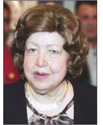
نائبة الرئيس السوري «نجاح العطار»