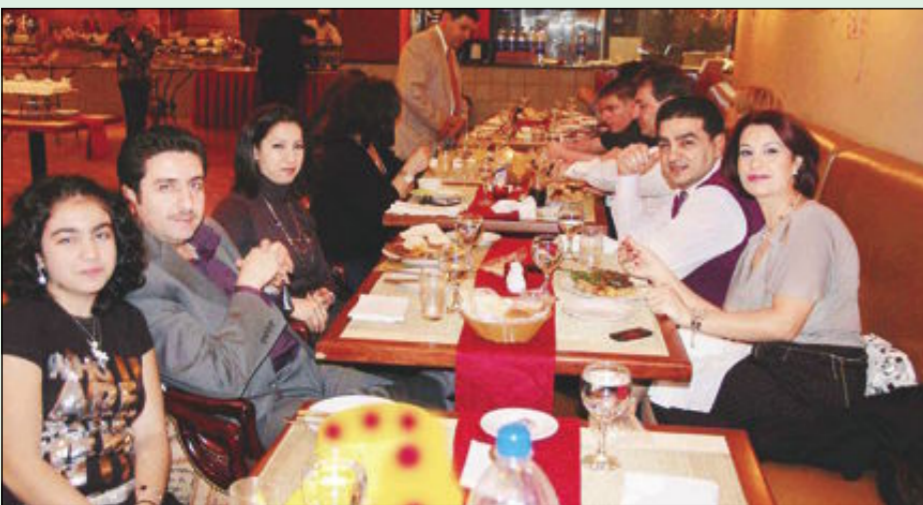
العائلات تستمتع بحسن الاستقبال