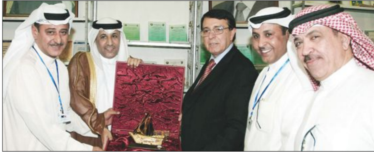
وزير الثقافة السوري د. رياض نعانان أغا مع السفير الكويتي عزيز الديحاني

ومشاركة 389 دار نشر عربية وإجنبية. وأكدت العطار في تصريح لوكالة الأنباء الكويتية خلال زيارتها لجناح وزارة الإعلام الكويتية أن «دولة الكويت كانت