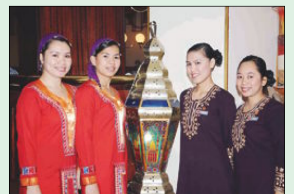
عدد من طواقم العمل الفروزة لرمضان