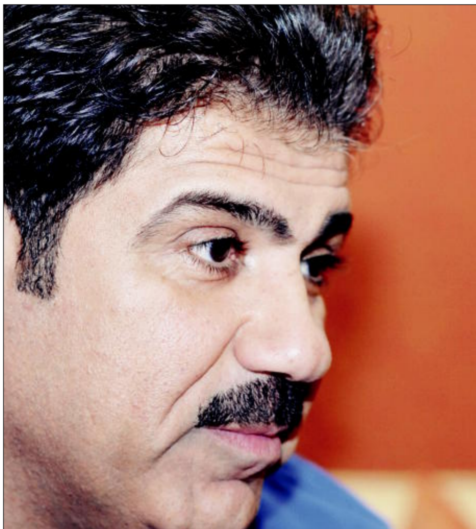
ضيف «النهار» يستمع للأسئلة