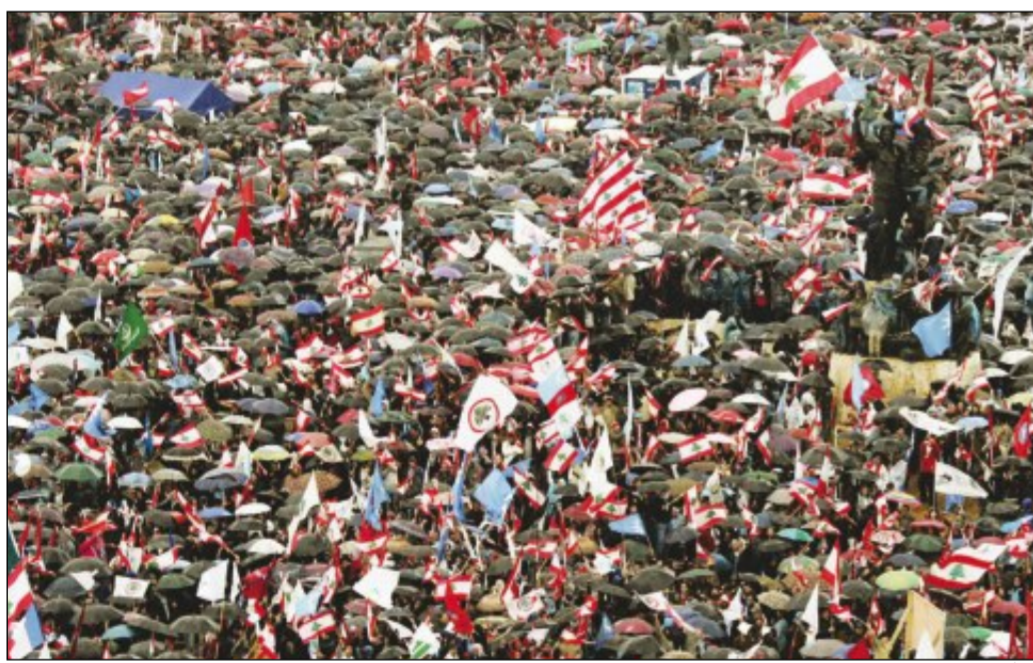
مئات الآلاف من اللبنانيين الذين أحيوا ذكرى استشهاد الحريري

بيروت - الوكالات: شدد ابرز اركان قوى «14 آذار» الحاكمة في لبنان امس امام مئات الآلاف من انصارهم الذين احتشدوا في وسط بيروت لاجراء الذكرى الثالثة لاغتيال رئيس الحكومة الاسبق رفيق الحريري على اولوية انتخاب رئيس جمهورية للبلاد.