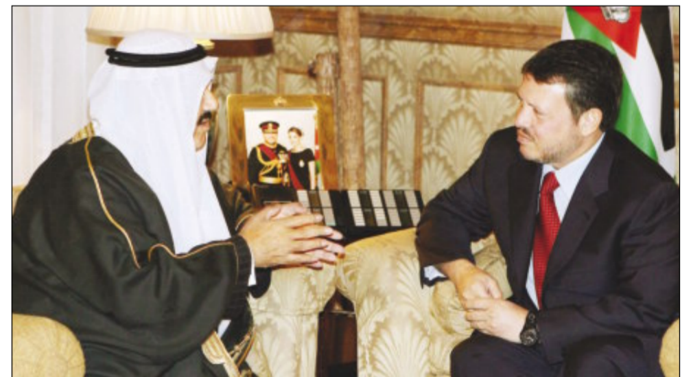
العامل الأردني يستمع إلى سمو رئيس الوزراء