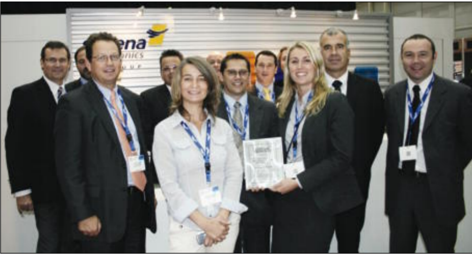
الشركة حصلت على جائزة منظمة «الصيانة والتعميم والإمداد» MRO لعام 2009

وشدد على انه يجب ان تتم مساعدة الشركات بشكل عام إلى تطوير نظم الإفصاح المالي لديها للسماح للجميع بالوقوف على مركزها المالي، فالبنك المركزي وسوق الكويت للأوراق المالية ووزارة التجارة مسؤولون عن تطوير متطلبات الإفصاح لجميع الشركات خاصة في ظل الأزمة الحالية.