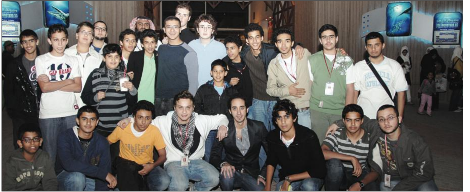
صورة تذكارية للوفدين السعودي والإماراتي من الشباب أمام المركز العلمي