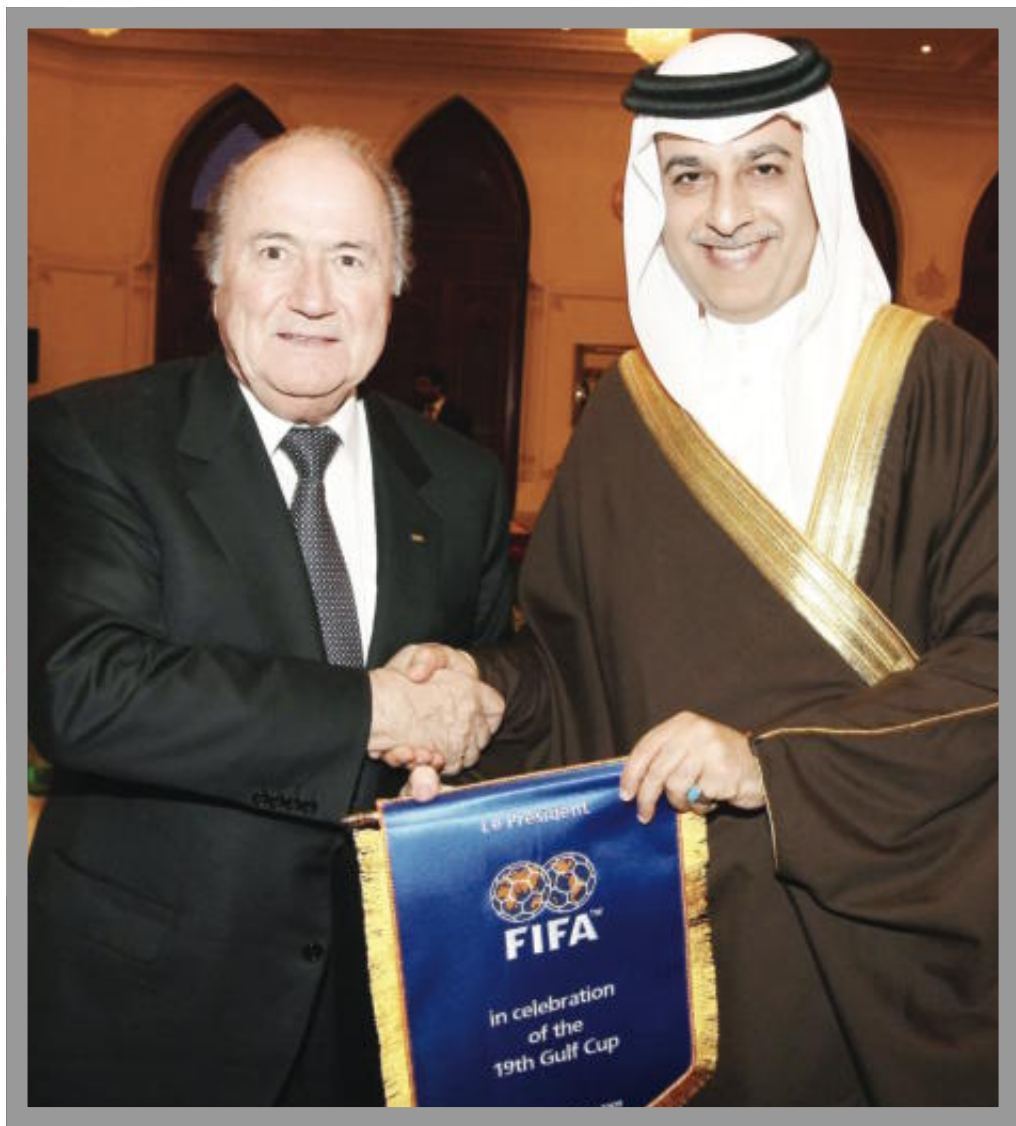
الشيخ سلمان بن إبراهيم مع جوزيف بلاتر في «خليجي 19» (الأزرق، كوم)

■ ما ردك على اتهامات بن همام؟ ■ كلام بن همام واتهامه للاخرين خطير وكبير وحاول ان يفسره باناه مثل عربي لكن في منقلبتنا لم نسمع به وانما لغة التهديد وامر غريب، فهذا لا يتوافق مع مبادئنا