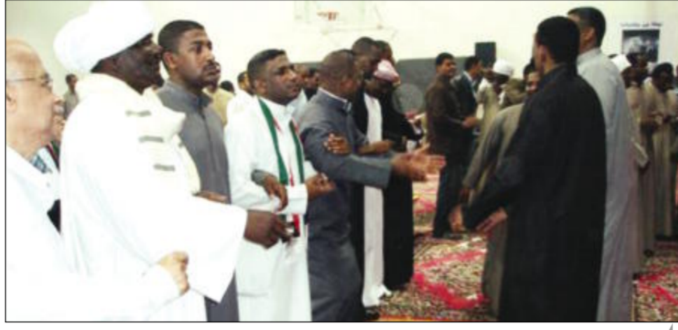
غناء ورقص نوبي