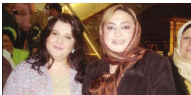
الفنانة المعتزلة ناهد يسري والحامية نجلاء النقي