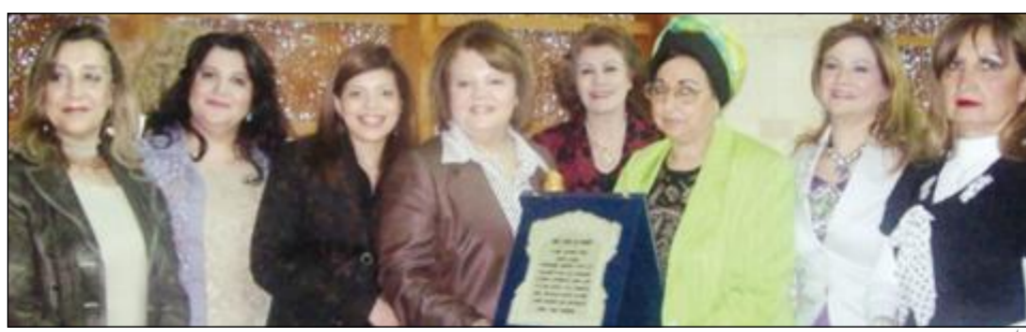
تبادل دروع التكريم