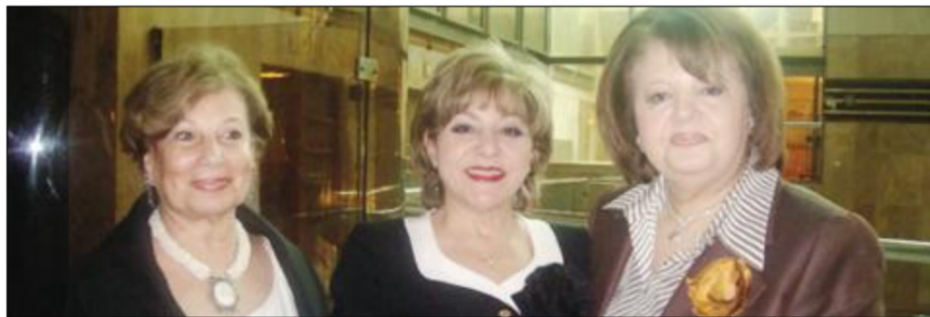
صاحبة الدعوة وعدد من قريباتها