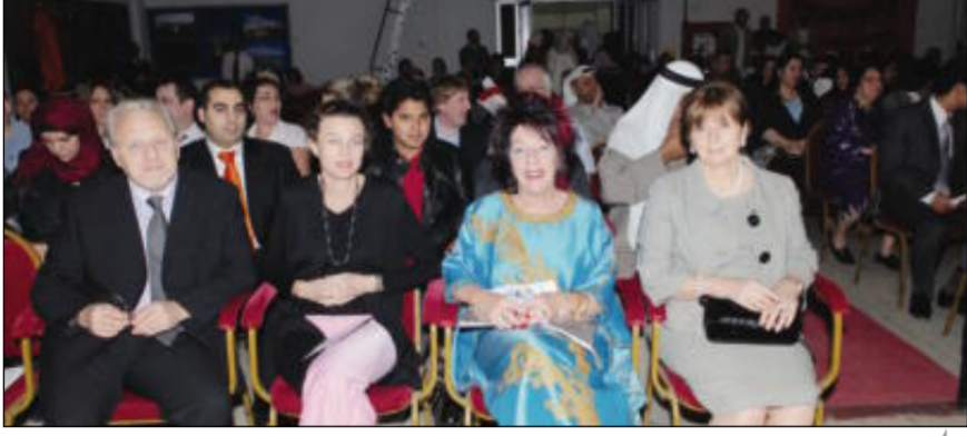
جانب من الدعويين