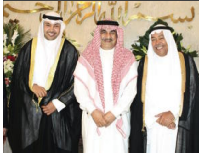
عبدالحسين عبدالرضا مهنياً