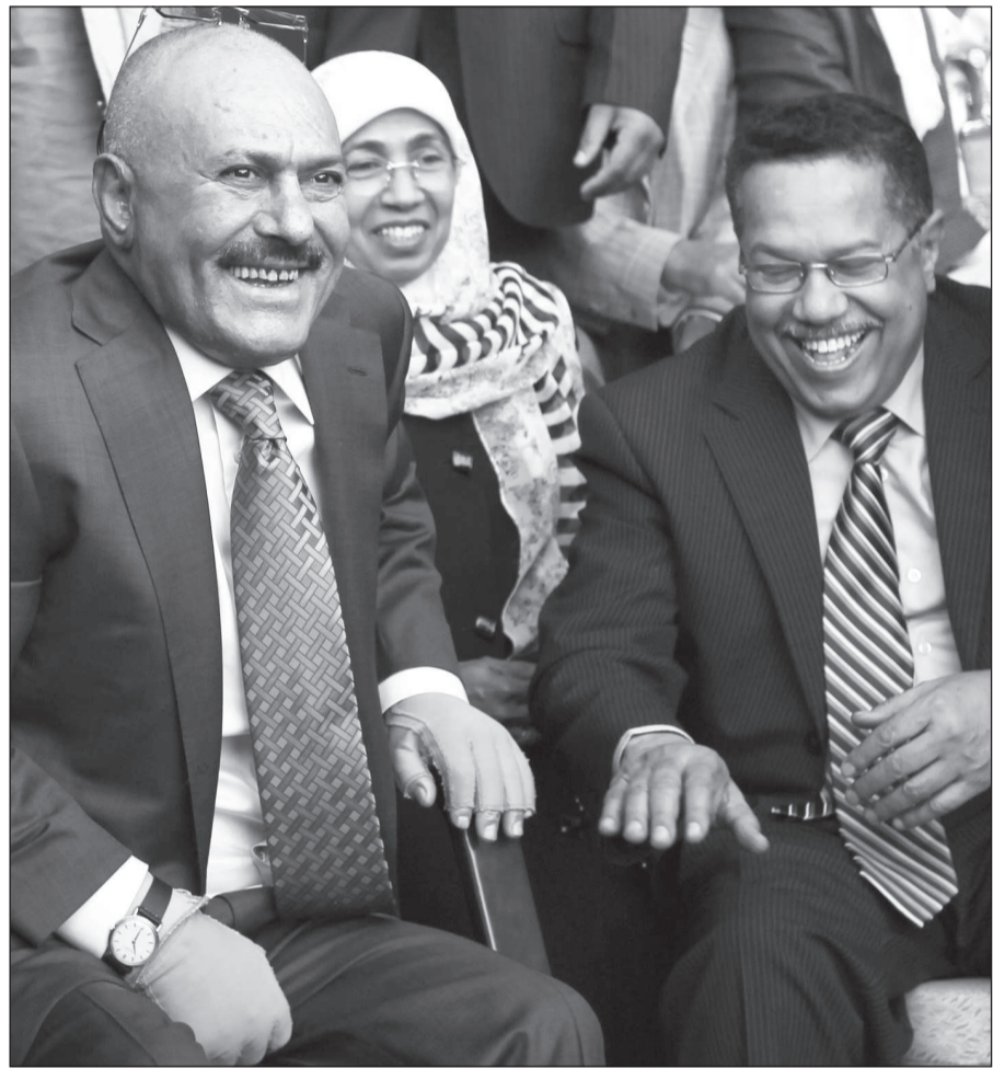
الرئيس اليمني السابق محتفلاً بالذكرى الأولى لتسليم السلطة (أ. ف. ب)

صحافي بعد يومين من المفاوضات في الماتي بكازاخستان «أمل في أن ينظر الجانب الإيراني إيجاباً إلى المقترح الذي قدمناه». واضافت ان «لاقتراح يرمي الى اعادة الثقة والسماح لنا بالتقدم» للتوصل الى حل دبلوماسي لازمة ملف إيران النووي. وفي السياق ذاته، أشارت صحيفة «ديلي تلغراف» البريطانية الى ان «منشأة أراك الإيرانية للمياه الثقيلة جاهزة للتشغيل». وأفادت الصحيفة ان «هذا الامر يثير مخاوف من ان إيران تحاول إنتاج مادة البلوتونيوم لقتلبة نووية في المنشأة». وذكرت الصحيفة ان «السلطات الإيرانية لا تسمح للمفتشين الدوليين بزيارة منشأة أراك منذ ثمانية عشر شهراً وان الوكالة الدولية للطاقة الذرية وحكومات غربية على علم بما يجري فيها منذ فترة». وقال المسؤول الذي طلب عدم نشر اسمه ان الاجتماع كان «مفيداً» إذ اتفق الجانبان على تواريخ وأماكن للاجتماعات المقبلة التي ستجري على مستوى الخبراء في اسطنبول يوم 18 مارس مع انطلاق جولة جديدة من المحادثات السياسية في كازاخستان في الخامس والسادس من ابريل. من جهتها أعلنت وزيرة خارجية الاتحاد الأوروبي المكلفة بالاتصالات مع إيران باسم دول مجموعة 1+5 انها تأمل في «رد ايجابي» إيراني على مقترح هذه الدول. وقالت كاترين اشتون في مؤتمر