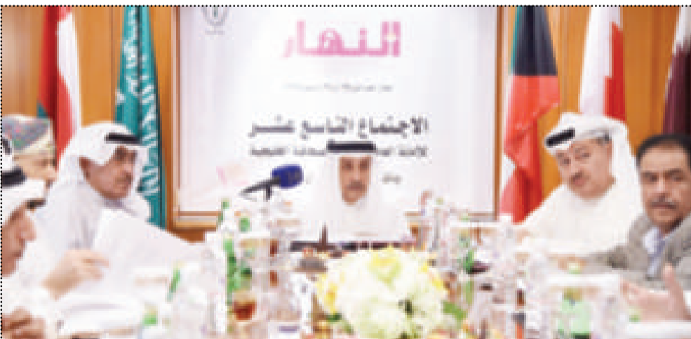
جانب من اجتماع الأمانة العامة لاتحاد الصحافة الخليجية

العثمان: مطلوب تأهيل الكوادر الصحافية الخليجية والارتقاء بها بوخمسين: تعزيز العمل الخليجي المشترك في وسائل إعلام «التعاون»