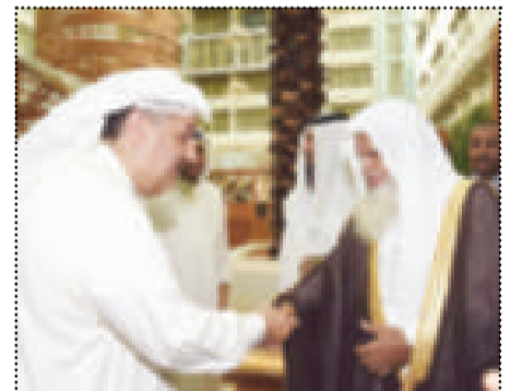
إمام المسجد النبوي مستقبلاً د. عماد بوخمسين

يذكر أن الدكتور الحديفي يزور البلاد هذه الأيام للمشاركة في حفل ختام جائزة الكويت الدولية لحفظ القرآن الكريم في دورتها السابعة والذي يقام اليوم تحت رعاية سمو أمير البلاد في قصر بيان.