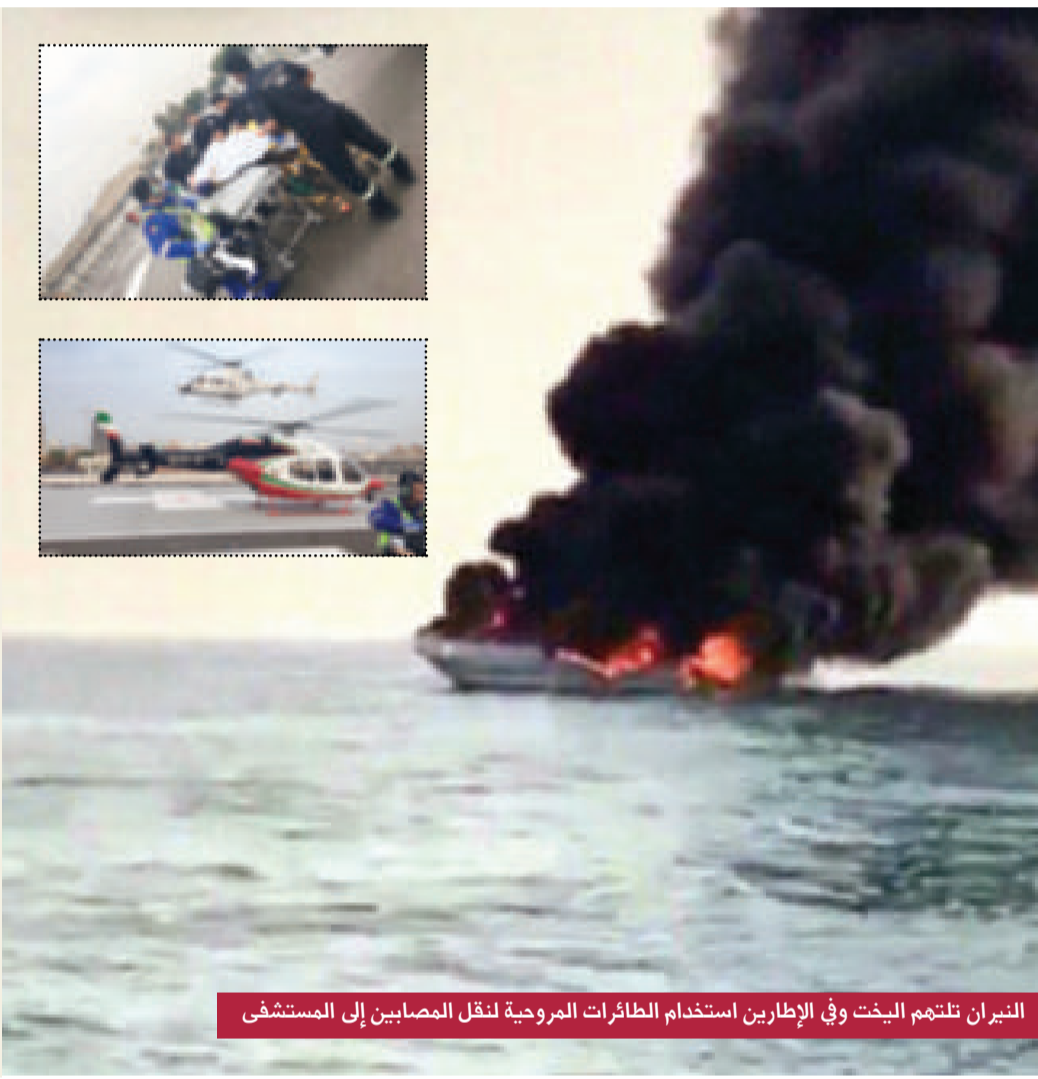
النيران تلتهم اليخت وفي الإطارين استخدام الطائرات مروحية لنقل المصابين إلى المستشفى

كشفت مصادر تربوية مطلعة عن توجه ديوان الخدمة المدنية نحو تعديل دوام المدارس لبدء في السابعة صباحا ويستمر حتى الثانية ظهرا، وذلك لتقليل تأثير تخفيض ساعات العمل الذي اقر للموظفات اللاتي يتمتعن بتخفيض العمل ساعتين في بداية أو نهاية الدوام تقديرا لقانون رعاية الطفل. واشارت المصادر الى ان نشرة تصدر من قطاع التعليم العام بهذا الخصوص بداية الفصل الدراسي الثاني، وعليه سيبدأ دوام