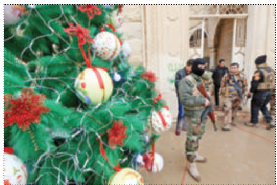
● بلدة برطلة العراقية تحتفل بعيد الميلاد بعد تحريرها من «داعش» وترميم كنائسها

عواصم - الوكالات: استنفرت دول الغرب امناً مع بدء اسبوع اعياد الميلاد ورأس السنة على وقع هجمات ارهابية متلاحقة حيث حذرت واشنطن رعاياها من السفر الى مصر والأردن بسبب خطر تعرضهم لاعتداءات تطال الكنائس والمواقع السياحية في حين نشرت فرنسا عشرات الآلاف من رجال الجيش والشرطة لتأمين الاحتفالات بينما لوحث ألمانيا بطرد المهاجرين واللاجئين «المرفوضين» من دول المغرب العربي بعد اعتداء برلين الذي نفذه التونسي انيس العامري بشاحنة وقتل فيه 12 شخصاً بينما فككت تونس خلية مرتبطة بالعامري الذي قتلته الشرطة الإيطالية الجمعة ما أثار أسئلة أمنية حول عبوره ثلاث دول اوربية... (طالع ص 27).