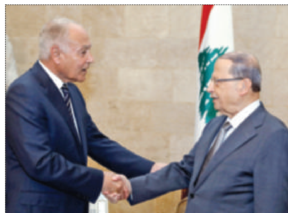
الرئيس عون مستقبلاً الأمين العام لجامعة الدول العربية أحمد أبو الغيط