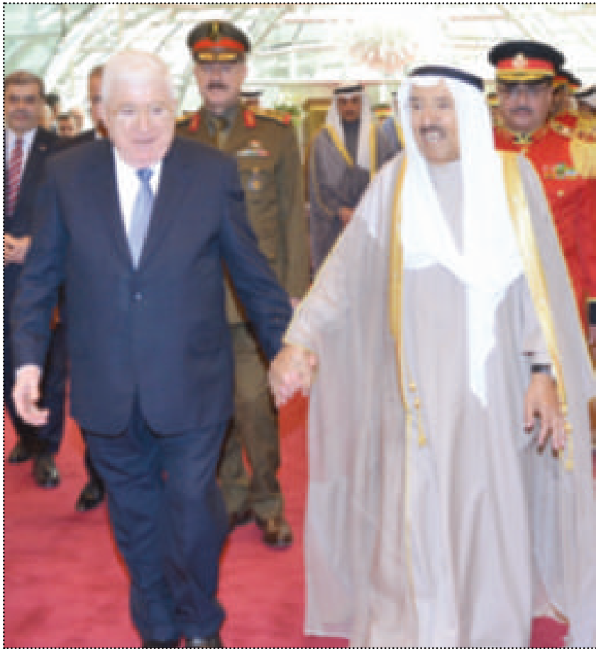
سمو أمير البلاد مستقبلاً الرئيس العراقي