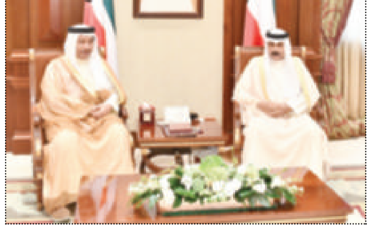
● سمو نائب الأمير استقبلًا سمو الشيخ جابر المبارك