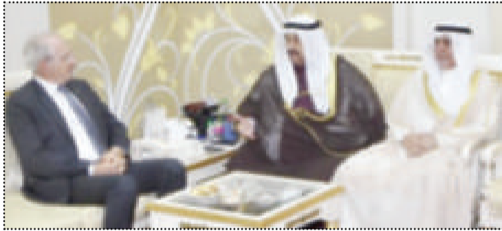
● سمو الشيخ ناصر المحمد استقبلًا السفير اليوناني

استقبل سمو الشيخ ناصر المحمد في قصر الشويخ اندرياس باباداكيس سفير جمهورية اليونان لدى الكويت، حضر المقابلة المستشار د. اسماعيل الشطي.