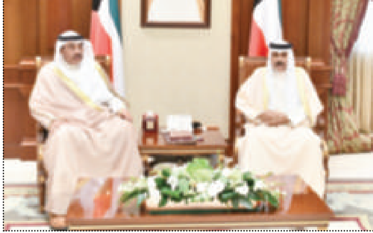
● سموه لدى استقباله الشيخ صباح الخالد