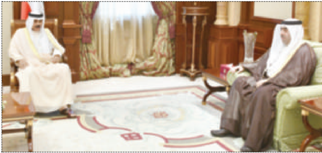
● سموه لدى استقباله رئيس المجلس البلدي

استقبل سمو نائب الامير ولي العهد الشيخ نواف الاحمد بقصر بيان صباح أمس سمو رئيس مجلس الوزراء الشيخ جابر المبارك. واستقبل سموه نائب رئيس مجلس الوزراء وزير الخارجية الشيخ صباح الخالد. كما استقبل سموه نائب رئيس مجلس الوزراء وزير الداخلية بالوكالة أنس الصالح. واستقبل سموه رئيس المجلس البلدي اسامة العتيبي وذلك بمناسبة صدور المرسوم الاميري بمنحه درجة وزير.