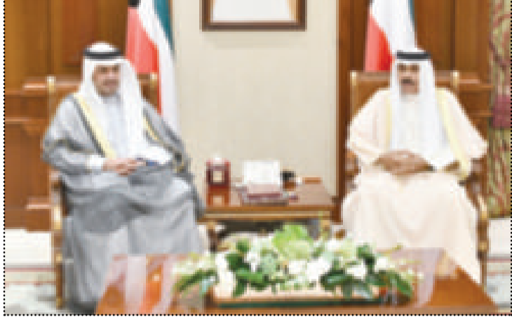
● سمو نائب الأمير استقبلًا أنس الصالح