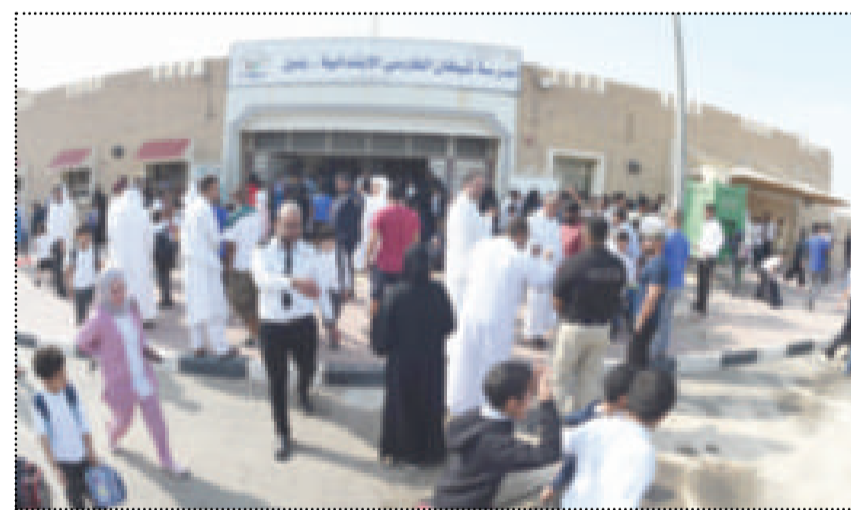
● مدرسة شيخان الفارسي الابتدائية حيث وقع الحادث

أولياء الأمور: وزارة التربية لا تؤمن المساحات القريبة من المدارس لماذا لا تتم الاستعانة بالمتقاعدين لمراقبة حركة المرور أمام المدارس؟