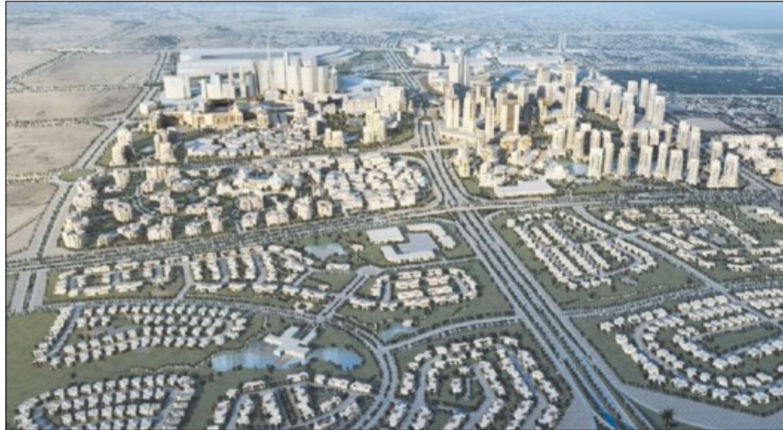
نموذج للمشروع الذي يضم 6 فنادق راقية

وسوف تقوم «بوادي» بتحويل حقوق الانتفاع بالأراضي لصالح الشراكة الجديدة بشكل تدريجي ووفقاً لمقتضيات مراحل التنفيذ، تبعاً لذلك ستقوم إعمار بتقديم الحصة المقابلة لمساحة الأرض المحولة في كل مرحلة على شكل سيولة نقدية. ويتوقع أن تبدأ هذه الشراكة بتحقيق أرباحها بحلول العام 2009. كما يتوقع القائمون على المشروع بأن يحقق عائداً سنوياً في الاستثمار تتجاوز نسبته 15%.