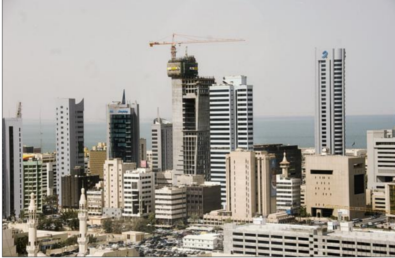
مطالبات بدخول البنوك التقليدية على خط الرهن العقاري

● 8 صفقات تم بيعها خلال الأسبوع مشاع وقد بلغت مساحتها 6878.764 متراً مربعاً قيمتها 38.024 مليون دينار توزعت بين صفقة في الروضة 62.82 متراً بقيمة 37.692 ألف دينار وبيت في كيفان مساحته 181.25 متراً بقيمة 100 ألف دينار وبيت في اليرموك مساحته 525 متراً بقيمة 325 ألف دينار وأرض تجاري في المرقاب 4642.5 متراً بقيمة 37.14 مليون دينار وأرض استثماري في حولي 137.694 متراً بقيمة 93.33 ألف دينار وبيت في الجليب بمساحة 235.75 متراً بقيمة 80 ألف دينار وبيتان في الجهراء أحدهما بـ 562.5 متراً بـ 130 ألف دينار وبيت 531.25 متراً بـ 113.332 ألف ديناراً.