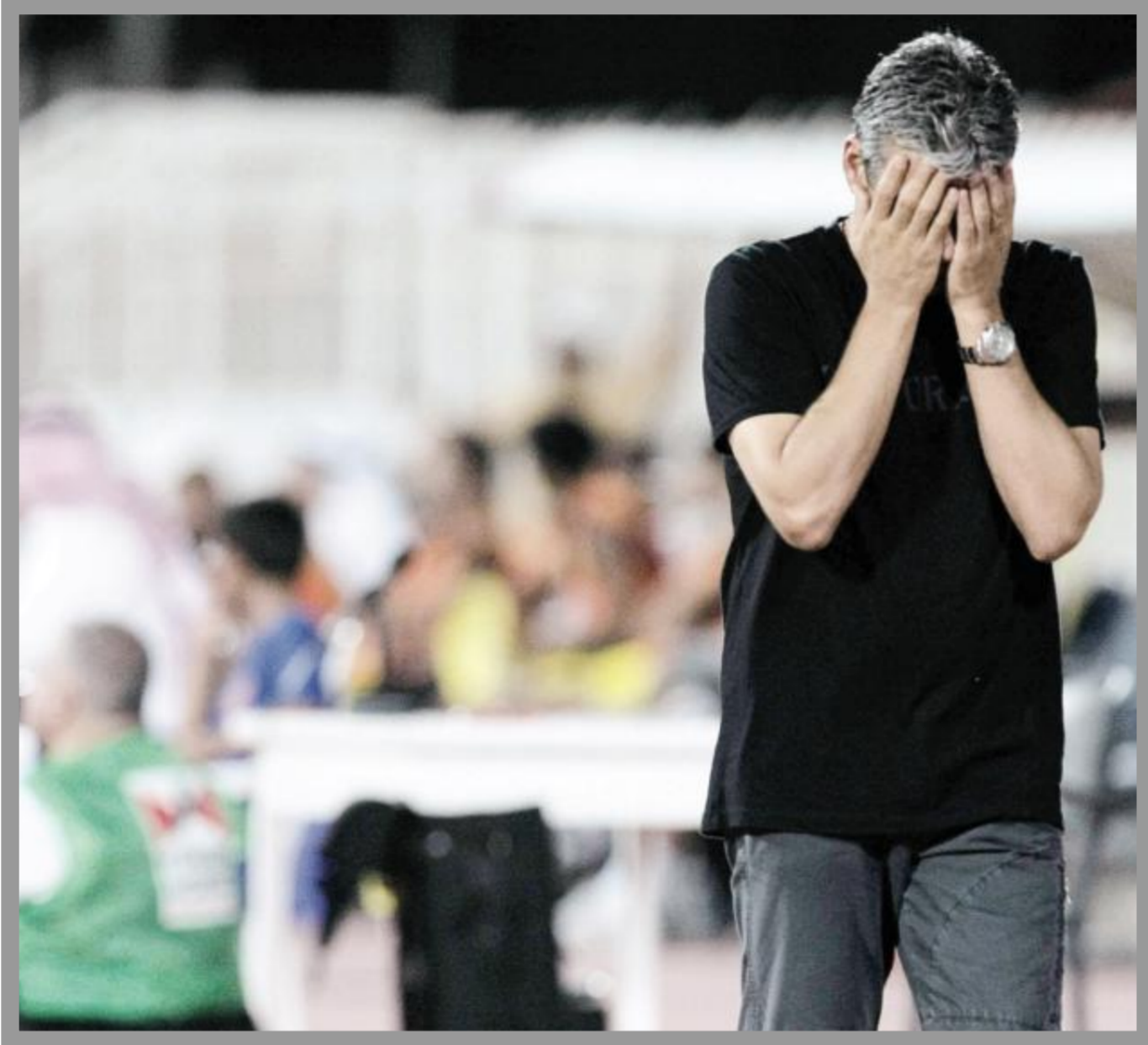
مدرّب الكويت كلوزين في حاجة لمضاعفة جهوده قبل لقاء أربيل المصري (أزرق، كرم)