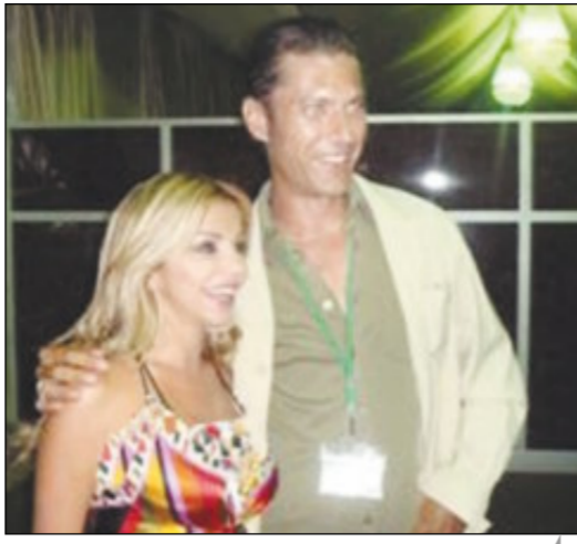
زوران المغربي في حفل عيد ميلادها بلبيبا

يذكر أنّ زوران أنهت مؤخراً تصوير فيلمها الجديد «حكم الغرام»، الذي يشاركها البطولة فيه النجم المصري خالد النبوي ومن المقرر أن تبدأ دور العرض بعرض الفيلم خلال أيام عيد الفطر السعيد.