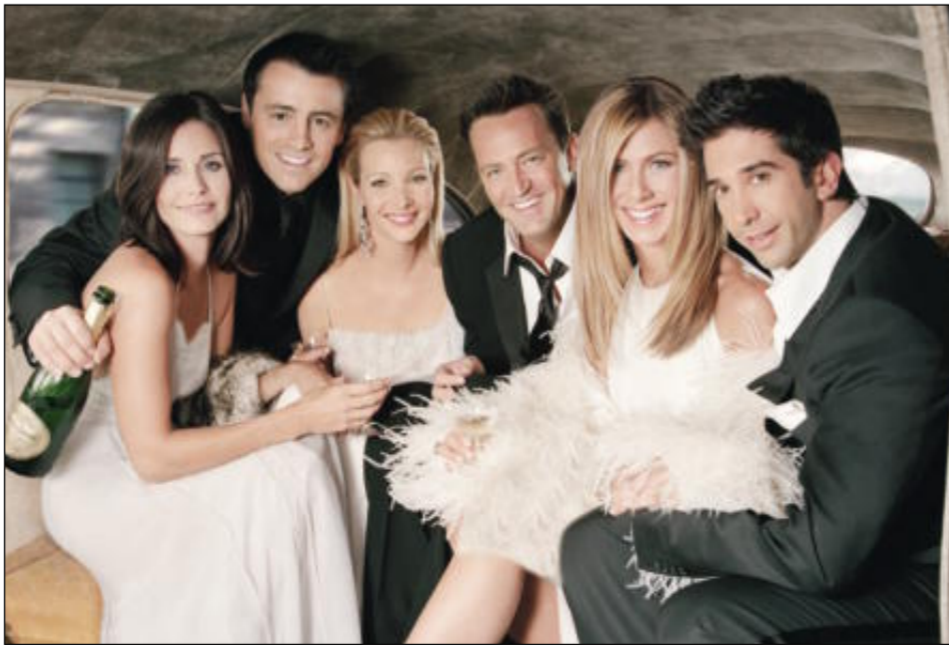
نجوم مسلسل الاصدقاء

الجدير بالذكر أن النسخة ثلاثية الابعاد للفيلم المنتظر يحوي على 12 دقيقة اضافية من الفيلم الحافل بالوقرات البصرية المذهلة.