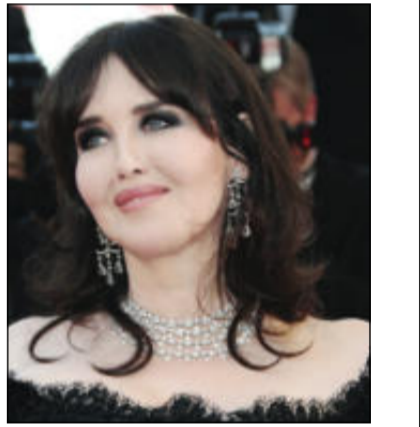
سيدة السينما الفرنسية