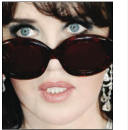
إيزابيل أدجاني.. خلف النظارة

آخر أعمالها كان فيلم «بابارا تزي» عام 1998، مع المخرج الأن بيريريان، ومن قبله كان فيلم «شيطانية» أمام شارون ستون عام 1996، ثم بعض الحضور، ولكنها عادت لتغيب بشكل كامل. وحينما سئلت منذ فترة عن سبب غيابها، جاء ردها في حديث مع المذيع التلفزيوني ميشيل دروكار قائلة: