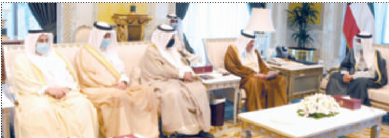
سمو ولي العهد لدى استقباله رئيس وأعضاء غرفة التجارة

الصقر: الإصلاح الشامل لكل النواحي أصبح شرط بقاء لا شرط رخاء