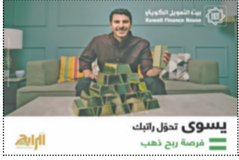
يسوي تحول راتبك فرصة ربح ذهب