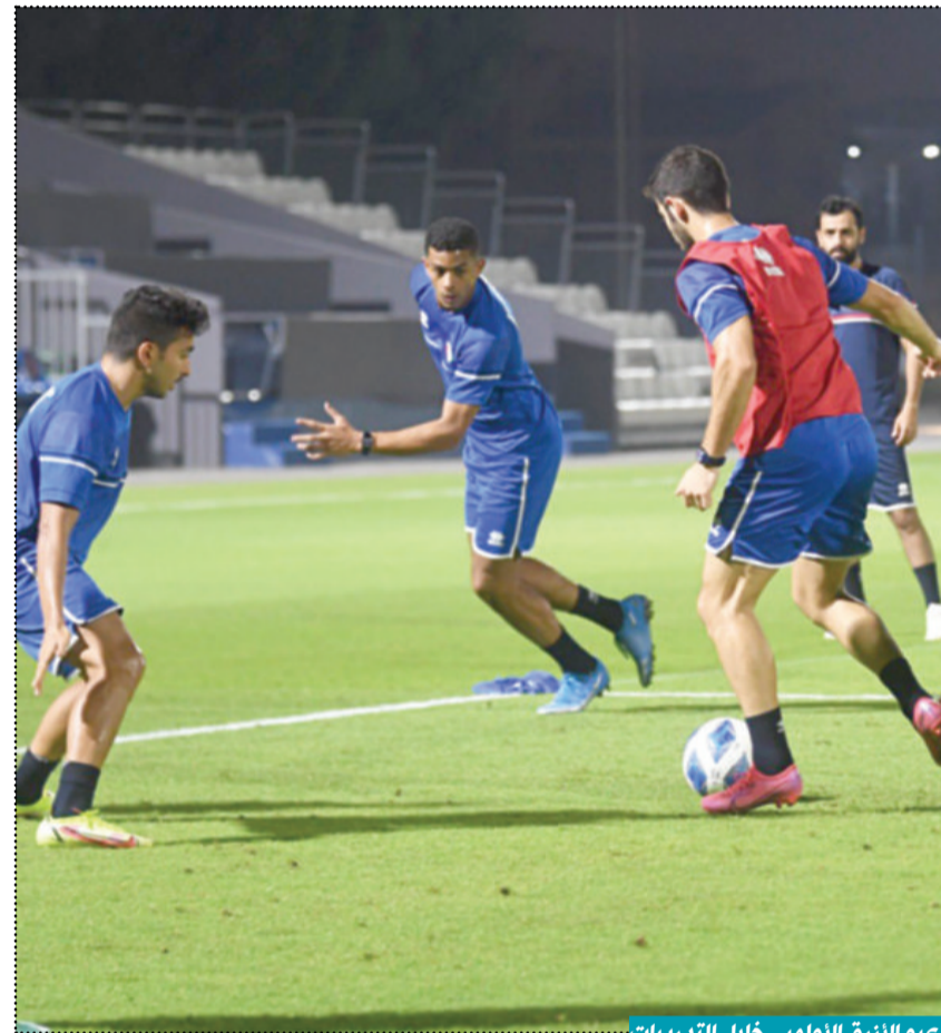
لاعبو الأزرق الأولمبي خلال التدريبات

يطلب الأزرق الأولمبي مع نظيره القطري في 06:00 مساءً اليوم على استاد سحيم بن حمد في مباراة ودية ضمن استعدادات المنتخبين لتصفيات كأس آسيا للمنتخبات الأولمبية. ويلعب الأزرق ضمن المجموعة الرابعة إلى جانب منتخبات السعودية وأوزبكستان وبنغلادش، وكان من المفترض أن تستضيف البلاد منافسات المجموعة خلال الفترة من 23 إلى 30 أكتوبر الحالي، قبل أن يعتذر اتحاد الكرة عن الاستضافة بسبب رفض السلطات الصحية في البلاد دخول أعضاء وفد المنتخب البنغالي لأنهم لم يتلقوا لقاح فيروس كورونا. وتقرر أن تقام التصفيات خلال الفترة من 27 أكتوبر إلى 2 نوفمبر المقبل، بينما لم يتحدد بعد مكان التصفيات ما بين دبي والدوحة والسعودية. ويقيم الأزرق الأولمبي حالياً معسكرًا تدريبيًا في الدوحة منذ خروجه من الدور الأول لبطولة غرب آسيا التي أقيمت في الدمام والخبر، واحتل فيها الأزرق المركز الأخيرة في مجموعته التي ضمت منتخبات الأردن وعمان واليمن، حيث خسر من الأول 2-1، وتعادل مع الثاني والثالث بنتيجة 1-1 في اللقاءين.