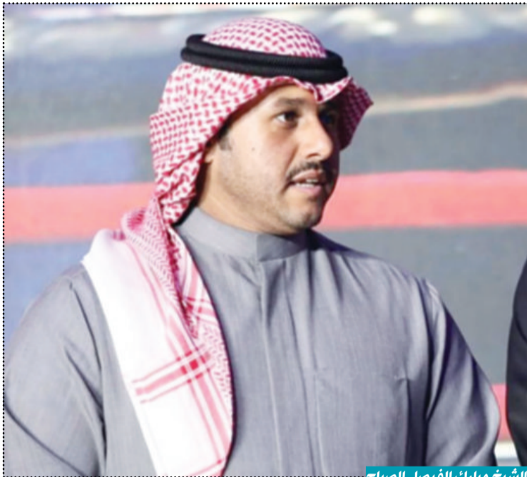
الشيخ مبارك الفيصل الصباح

نجحت في توفير مضمار وكحل مؤقت من خلال التعاون مع حلبة السيارات في مدينة الكويت لرياضة المحركات، حيث سيتم تخصيص يومي السبت والأحد من كل إسبوع لمزاولة رياضة الدراجات الهوائية، لافتاً إلى أن يوم السبت سيكون من الساعة السابعة صباحاً إلى الساعة الحادية عشر صباحاً فيما سيكون يوم الثلاثاء من الساعة الرابعة عصراً إلى الساعة الثامنة مساءً. وتمنى الصباح أن تلقى جهود اللجنة الأولمبية نجاحاً لاسيما وأن الهدف الأهم هو سلامة اللاعبين وتوفير الأجواء الآمنة والمناسبة للوصول إلى المستويات المطلوبة.