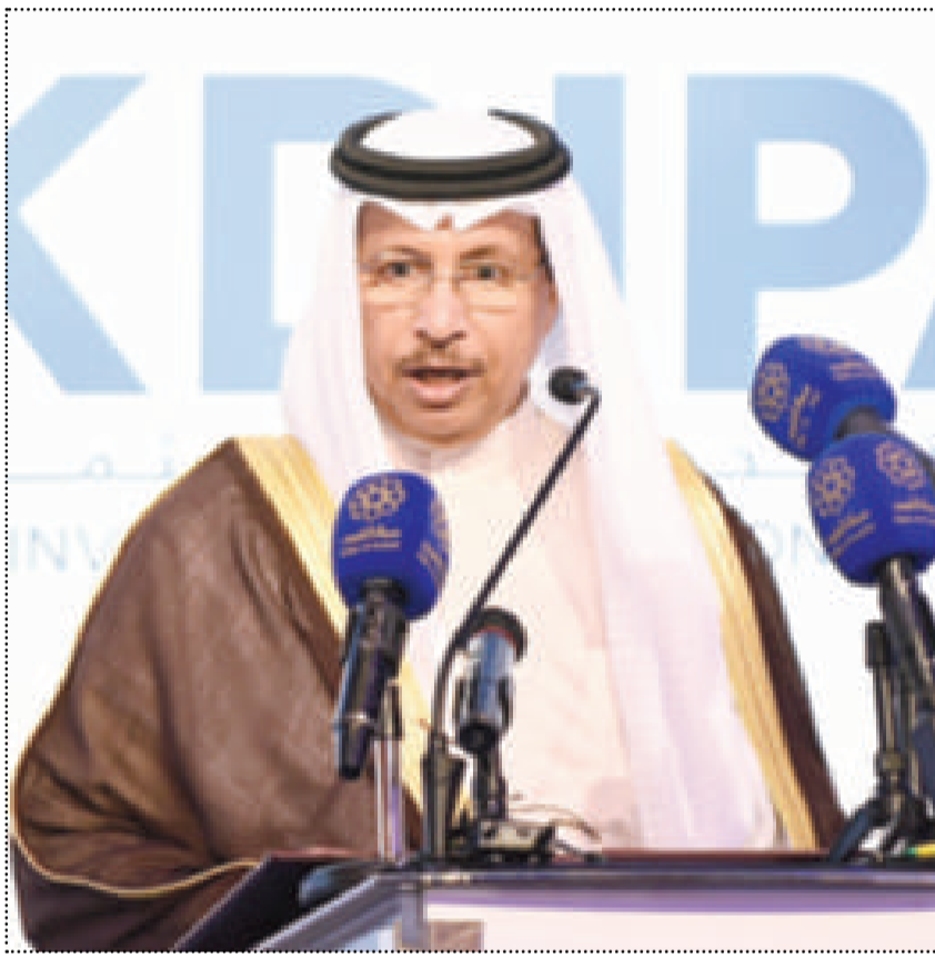
سمو الشيخ جابر المبارك مفتتحاً ملتقى الكويت للاستثمار

عبدالصمد: تخفيض ميزانيات جميع الجهات الحكومية بنسبة 20%