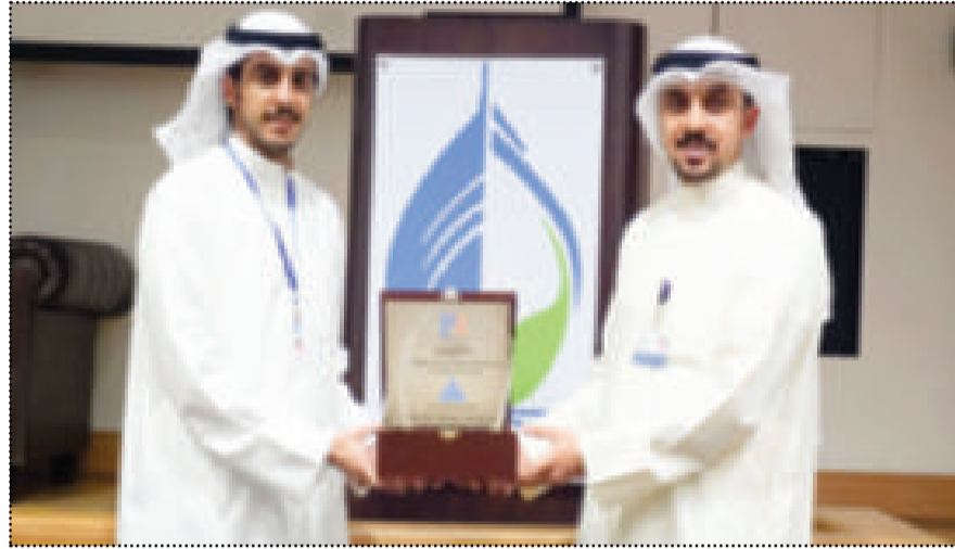
● جامعة «الخليج» تكرم البنك «الدولي»

... ويقدم ورشة عمل «العلاقات العامة وإدارة الأعمال» في جامعة الخليج